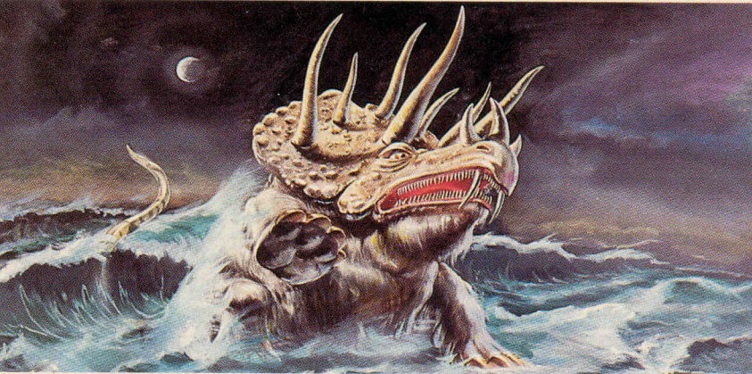
DET TREDJE DYRET i Daniels drøm ble fulgt av et fjerde som var «fryktelig og forferdelig» (Dan. 7).