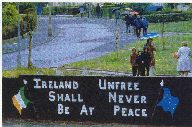
Pro-IRA-slagord til støtte for den sultestreiken Bobby Sands og andre gjennomførte i 1981.

Apostelen Paulus' ord gir en beskrivelse av dem som bragte forbannelse over Irland: "Deres munn er full av forbannelse og bitterhet. Deres føtter er snare til å utøse blod; ødeleggelse og usælhet [elendighet] er det på deres veier, og fredens vei kjenner de ikke " (Rom. 3:14-17, våre uthevelser).