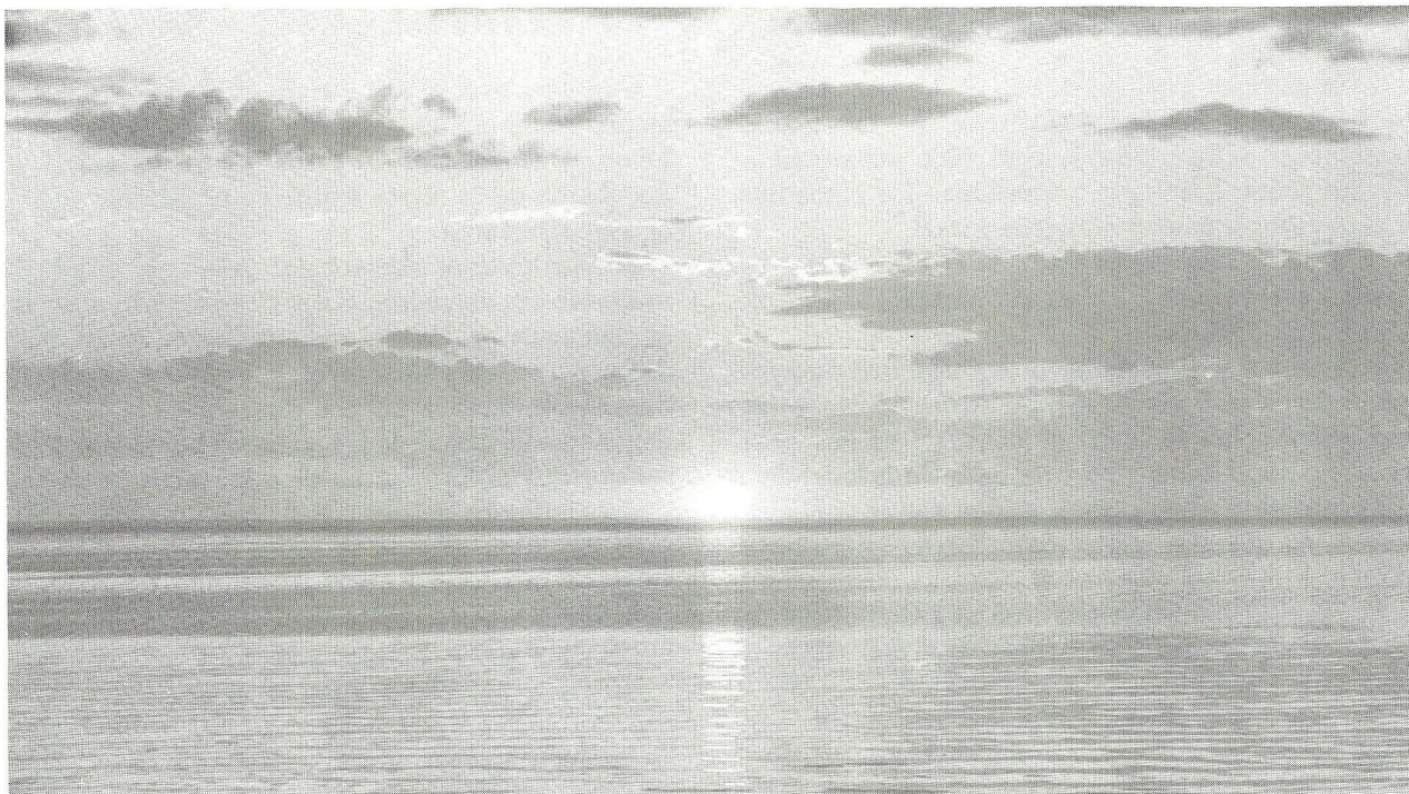
H. Armstrong Roberts

FREDAG AFTEN hver uke markerer begynnelsen på hellig tid — begynnelsen på Guds sabbatsdag. Guds folk fryder seg i sabbaten fordi de vet hvilken stor velsignelse det er å holde den hellig.