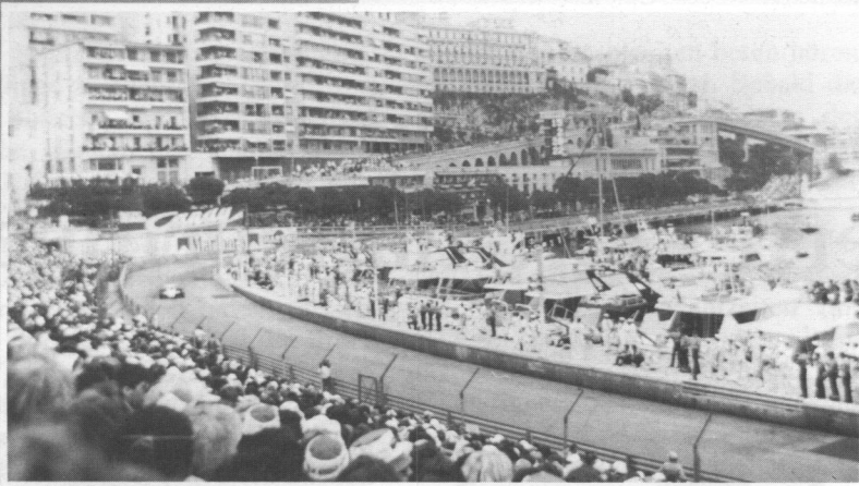
Zuschauermassen beim Großen Preis von Monaco. Viele Teilnehmer müssen unterwegs aus den verschiedensten Gründen aufgeben (unten).

bietet, ist: das unglaubliche Potential des Menschen, in die geistliche Gottfamilie hineingeboren zu werden.