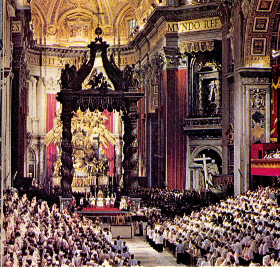
INTERIEUR VAN DE SINT-PIETER te Rome tijdens zitting van het Tweede Vaticaans Concilie.