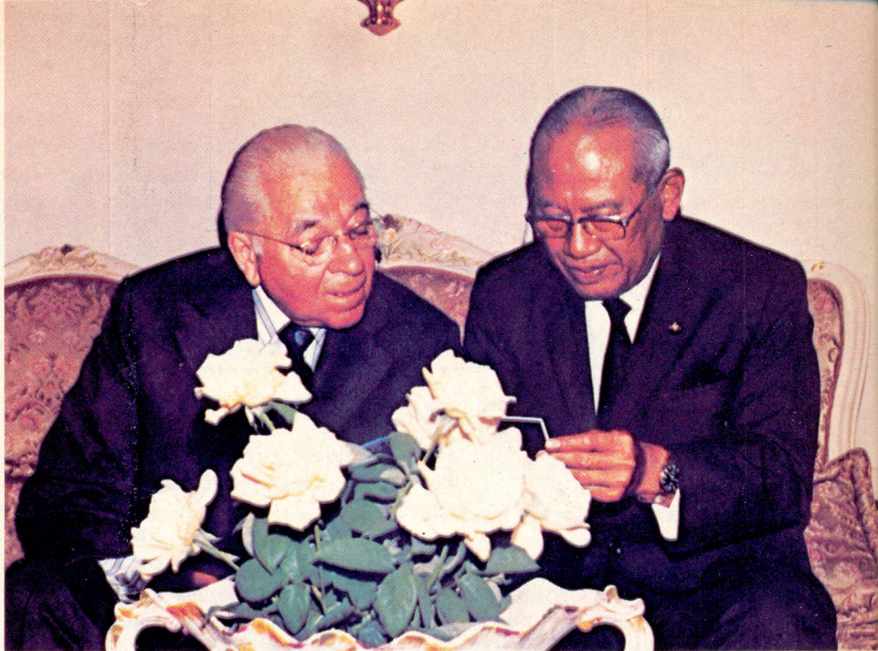
Premier Thanom Kittikatsjorn (rechts) en Herbert W. Armstrong (links).

Maar mijn opdracht is louter het te verkondigen of te onderwijzen — niet om wie dan ook te dwingen het