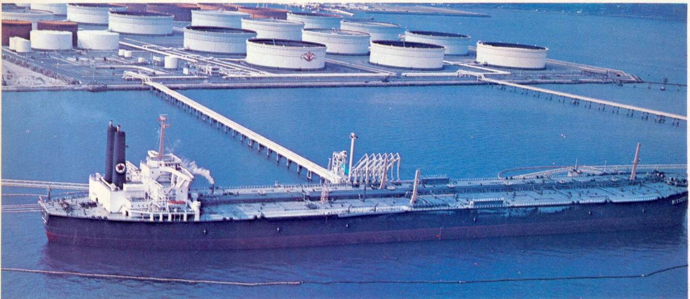
DE NISSEKI MARU , met 372 698 ton een der grootste tankers ter wereld, gemeerd bij het Kiire-tankopslagbedrijf. Dit bedrijf, gelegen aan de Kagosjima-baai, is uitgerust met 12 opslagtanks voor olie uit het Midden-Oosten

Maar de heilige plaatsen en gebouwen bezitten ook een transcendentale betekenis voor 500 miljoen moslems en meer dan een miljard christenen.