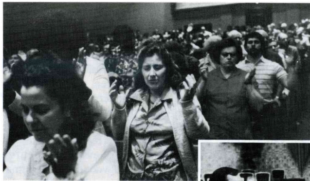
Hedendaagse „wonderen“? Hieronder en links: evangelische genezingsdienst. Alleen God heeft macht over natuurwetten en Hij beslist hoe, wanneer en waar Hij een wonder laat gebeuren.

De vraag wie de grootste in Israël was, God of Baäl, zou voor eens en altijd worden uitgevochten. Elia riep uit: „Hoelang zult gij aan beide zijden mank gaan? Indien de Here God is, volgt Hem na; maar indien het de Baäl