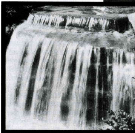
De Bijbel symboliseert Gods heilige Geest o.a. als een duif, water, vuur, olie, wind en een zegel, om aspecten van Gods karakter en macht aan te duiden.

Opnieuw echter dwalen de aanhangers van de drieëenheidsdoctrine hier.